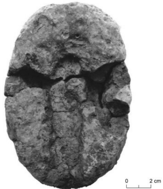
Kamnita taliina posoda s Starih gmajn (34. stoletje pr. Kr.). Na koliščih Ljubljanskega barja so se ukvarjali z metalurgijo bakra najmanj od 4. tisočletja pr. Kr. naprej.