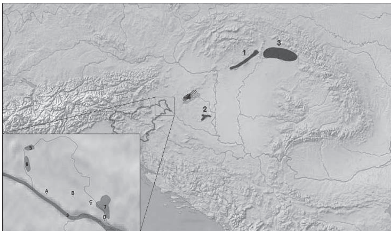
Slika 4. Črna območja – dokazana nahajališča surovin za izdelavo analiziranih kamenih orodij (1 – Severnomadžarsko hribovje, 2 – Meček, 3 – Karpati), šrafrirana območja – hipotetična nahajališča surovin za izdelavo analiziranih kamenih orodij (4 – severna obala Blatnega jezera, 5 – severozahodno Goričko, 6 – zahodno Goričko, 7 – Lendavske gorice, 8 – struga reke Mure).

Figure 4. Black areas – confirmed deposits of the raw materials used in the analysed lithic production (1 – North Hungarian Mountains, 2 – Mecsek Mountains, 3 – Carpathian Mountains), cross-hatched areas – hypothetical deposits of the raw materials used in the analysed lithic production (4 – northern coast of Lake Balaton, 5 – northeastern Goričko Hills, 6 – western Goričko Hills, 7 – Lendavske gorice Hills, 8 – the Mura riverbed).