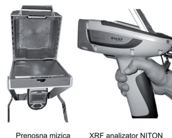
Slika 2. Prenosni XRF analizator NITON GOLDD XL3t+.

V okviru študije smo analizirali že inventarizirane arheološke artefakte z zgoraj naštetih arheoloških najdišč, ki jih hranijo v depojih Pomurskega muzeja, tj. dostopna odbitkovna in jedrna kamena orodja ter glajene sekire z dobro dokumentiranim najdiščnim kontekstom, torej z znano lego v stratigrafskem zapisu (za Katalog analiziranih arheoloških artefaktov glej Berden 2015, Pril. 1).